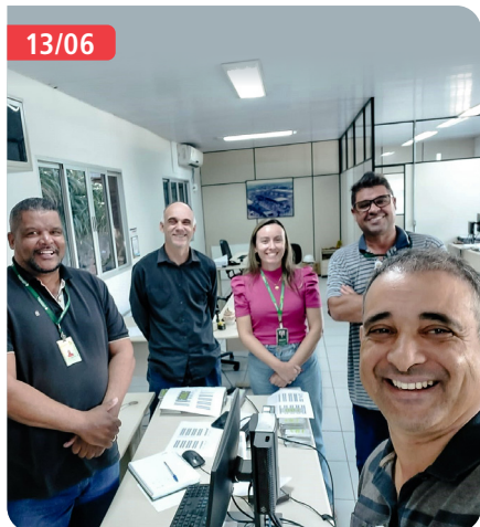
Aphcemg e CeasaMinas em reunião por melhorias aos produtores - O encontro visou identificar soluções para otimizar as condições de trabalho e infraestrutura, refletindo o compromisso da associação em atender às necessidades de seus associados.