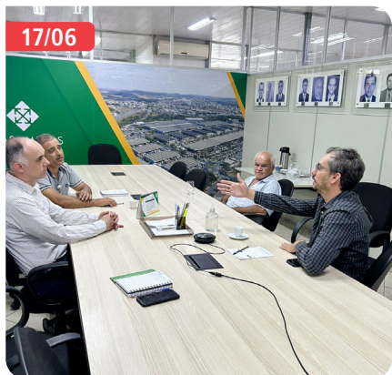
Representantes da Aphcemg reuniram-se na CeasaMinas, com a Diretoria Técnico-Operacional e a Gerência do MLP para reivindicar melhorias nos banheiros e discutir a urgência na reabertura do banheiro reformado.