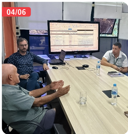
Reunião entre representantes da Aphcemg e da CeasaMinas define alteração do horário de marcação de áreas para 8 horas.